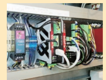
遠隔監視システムの設置例

また、2024年1月には本システムにて検知した異常情報を明電舎のカスタマーセンターで監視し、お客様が必要とするサポートを24時間365日体制で提供する新サービスを開始するなど、価値提供の拡充を図っています。