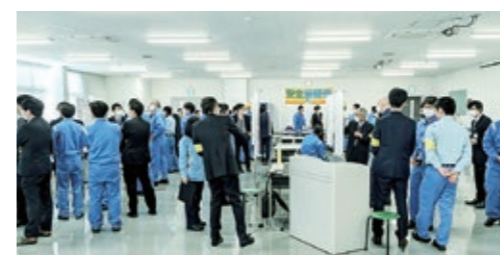
未来テーマコミュニティの様子

MASTプロジェクトの名称は、「(M)明電舎の(A)明日を(S)創造する(T)考える」の略であり、帆柱の意味も込めています。MASTプロジェクトでは、人と人、知恵と知恵が交わり合う対話を重視しており、様々な人の考えや情報に触れることでテーマに取り組む人の成長を促進し、個人アイデアレベルのテーマを事業へと成長させています。具体的には、各テーマは技術開発と事業開発の両面からアプローチしながら事業アイデアを練り上げ、事業部門や社内外の専門家との連携も図っています。また、仲間集めを促進する「未来テーマコミュニティ」といった場を定期開催し人財交流も促進しています。