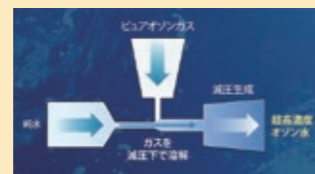
超高温・高純度ピュアオゾン水生成装置

新規事業を成功に導くためには、シーズ技術の知的財産化が重要になります。そこで、シーズ技術の潜在力を最大限に活用するため、実用化を視野に入れた権利範囲の設定・ポートフォリオ構築を行っています。これらの取組みにより、当社独自の技術を保護するとともにイノベーション活動の活性化により、競争上の優位性を確保しています。