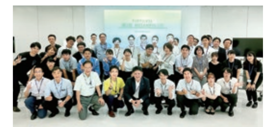
アイデアコンテスト「MEIANチャレンジ」

更に、新たな事業創出を目指し、ベンチャーキャピタルファンド等を活用しながら、当社との事業シナジーが期待できるスタートアップの探索やパートナー企業様との共創活動にも積極的に取り組んでいます。今後も、社外と積極的につながりを持つことを重視し、世の中の最新動向や社会課題に向き合いながら、新規事業創出を実現するイノベーション活動を推進していきます。