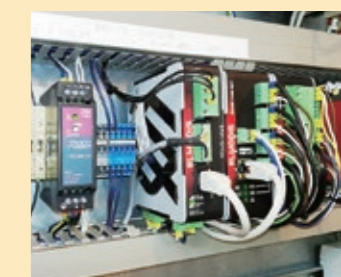
遠隔監視システムの設置例

また、2024年1月には本システムにて検知した異常情報を明電舎のカスタマーセンターで監視し、お客様が必要とするサポートを24時間365日体制で提供する新サービスを開始するなど、価値提供の拡充を図っています。