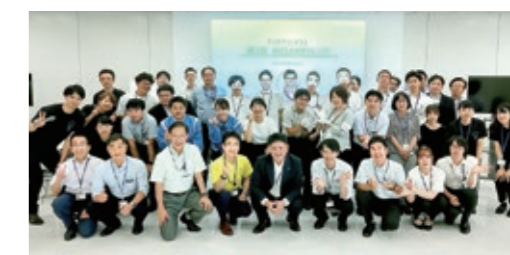
アイデアコンテスト「MEIANチャレンジ」

更に、新たな事業創出を目指し、ベンチャーキャピタルファンド等を活用しながら、当社との事業シナジーが期待できるスタートアップの探索やパートナー企業様との共創活動にも積極的に取り組んでいます。今後も、社外と積極的につながりを持つことを重視し、世の中の最新動向や社会課題に向き合いながら、新規事業創出を実現するイノベーション活動を推進していきます。