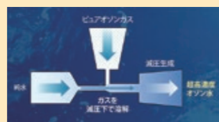
超高温・高純度ピュアオゾン水生成装置

新規事業を成功に導くためには、シーズ技術の知的財産化が重要になります。そこで、シーズ技術の潜在力を最大限に活用するため、実用化を視野に入れた権利範囲の設定・ポートフォリオ構築を行っています。これらの取組みにより、当社独自の技術を保護するとともにイノベーション活動の活性化により、競争上の優位性を確保しています。