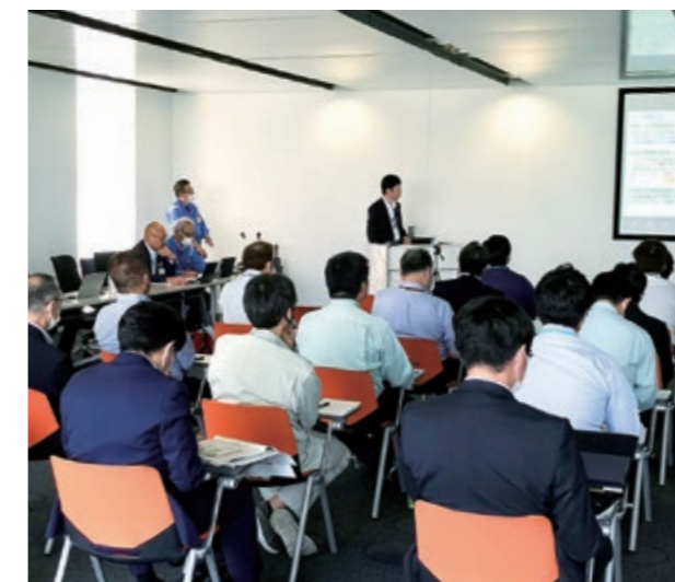
独立行政法人 中小企業基盤整備機構によるカーボンニュートラル導入セミナーの様子(沼津事業所開催)